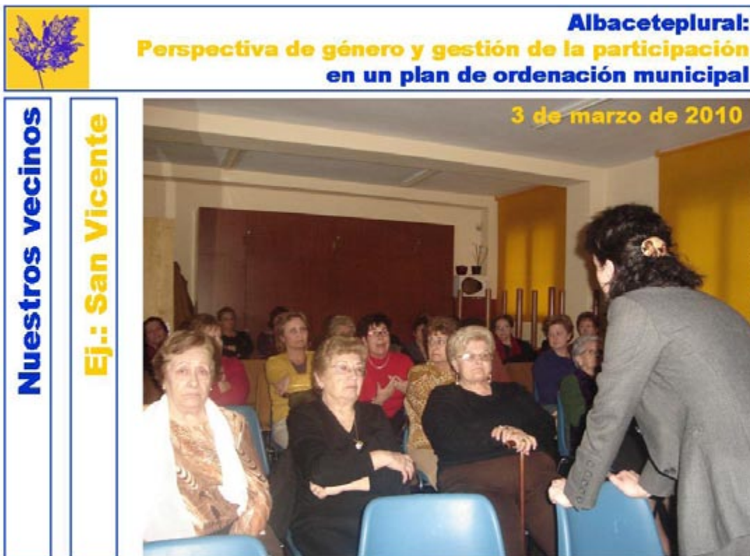
Figura 6. Imagen del trabajo en los talleres de barrios del proyecto albaceteplural. Material confeccionado por el equipo de participación in situ.

Del año que abarcó el proyecto (julio de 2009-junio de 2010), durante el 2009 se confeccionaron los materiales para los talleres y se realizó la explicación y difusión de la convocatoria; de enero a mayo de 2010 se celebraron los talleres y durante el mes de junio de 2010 se elaboró el informe final.