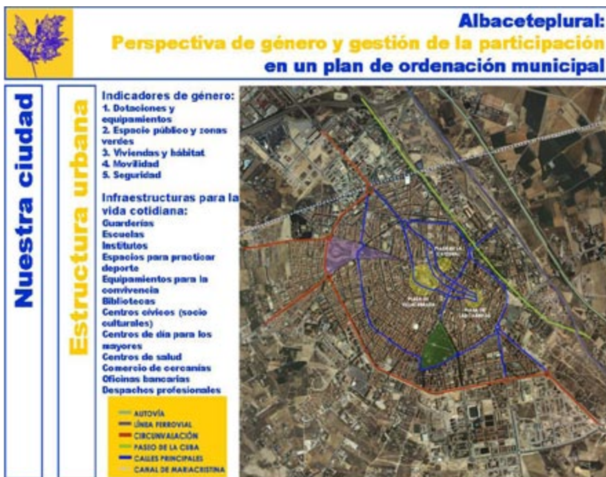
Figura 3. Estructura urbana de la ciudad de Albacete y glosario. Material de trabajo en los talleres (confeccionado por el equipo de participación in situ).

Los planes siguientes de los 80, e incluso de finales de los 90, carecen de una idea de ciudad: más bien van detrás de una realidad que posee sus propias dinámicas y que tratan, sin éxito, de controlar. (Figura 3).