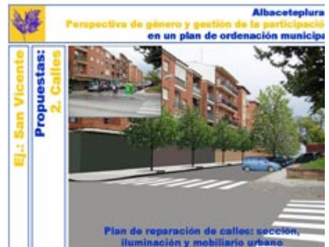
Figura 10. Propuestas para las calles. Material para incorporar al POM confeccionado por el equipo de participación in situ.