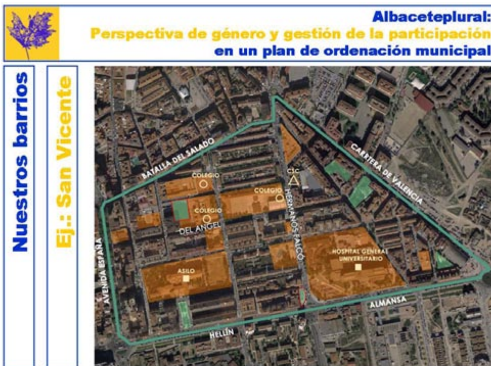
Figura 5. Ejemplo de barrio de la ciudad de Albacete. Material de trabajo en los talleres (confeccionado por el equipo de participación in situ).

Otra ventaja radica en que el perfil de los usuarios de estos centros es, en general, mayoritariamente femenino y, finalmente, que corresponden a estratos sociales que raramente disponen de otras oportunidades para ser escuchados.