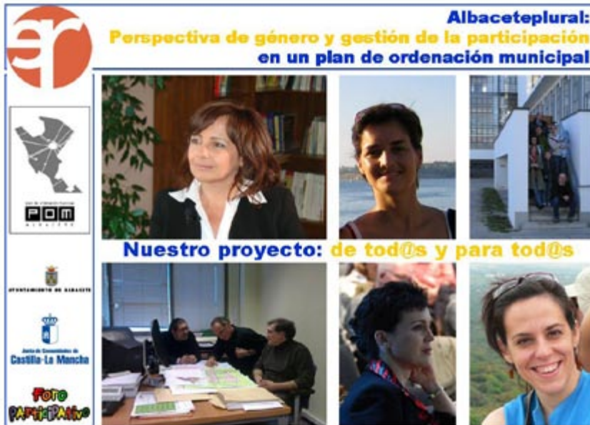
Figura 4. Presentación de instituciones y equipos. Material de trabajo en los talleres (confeccionado por el equipo de participación in situ).