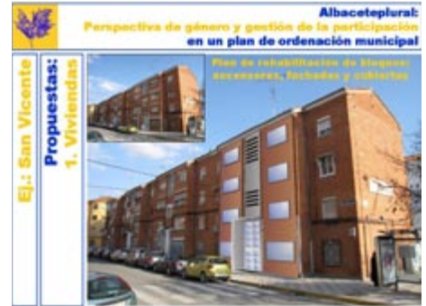
Figura 9. Propuestas para las viviendas. Material para incorporar al POM confeccionado por el equipo de participación in situ.