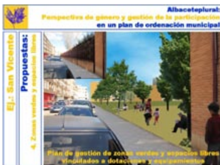
Figura 12. Propuestas para la gestión de zonas verdes y espacios libres. Material para incorporar al POM confeccionado por el equipo de participación in situ.