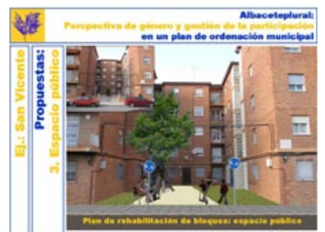
Figura 11. Propuestas para los espacios entre bloques. Material para incorporar al POM confeccionado por el equipo de participación in situ.