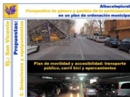
Figura 13. Propuestas para la construcción de dotaciones y equipamientos. Material para incorporar al POM confeccionado por el equipo de participación in situ.