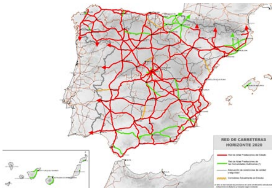
Figura 2. Mapa de la red de carreteras Horizonte 2020. Plan estratégico de infraestructuras y transporte, PEIT. Ministerio de Fomento. http://peit.cedex.es/

Esta circunstancia ha tenido su fiel reflejo en la estructura urbana: claramente lineal hasta mediados del siglo XIX en que llega el ferrocarril a la ciudad (1855) y radioconcéntrica a partir de ese momento al suponer la vía férrea una auténtica barrera al crecimiento, de momento infranqueable. [3]