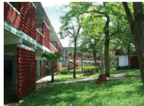
Figura 9: Instituto Preuniversitario en Ciudad Escolar Libertad, Arq. Josefina Rebellón, 1962.

Este ejemplo no sólo es representativo del contenido ideológico que asumió la arquitectura a partir de la conversión en escuela del antiguo Campamento Militar Columbia, sino de la nueva concepción de centros escolares de grandes dimensiones que se impuso poco después sobre la idea de construir entidades escolares aisladas, entre los que se destaca la Ciudad Escolar Camilo Cienfuegos en Santiago de Cuba [7]. Figura 11