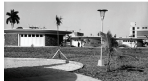
Figura 5: Escuela primaria Gustavo Pozo, Arq. Rafael Mirabal, 1963, 39 y Panorama, Nuevo Vedado.