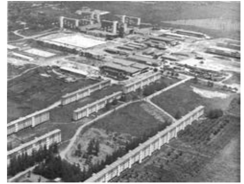
Figura 26: Ciudad Universitaria José Antonio Echeverría, CUJAE.

La arquitectura comentada es el contenedor en el que se ha realizado la loable labor de educación e instrucción de varias generaciones de cubanos a lo largo de las últimas cinco décadas. El recuento de lo hecho en ese campo permite extraer experiencias para el trabajo futuro, teniendo en cuenta que hacer buena arquitectura también debe formar parte de labor educativa de la Revolución.