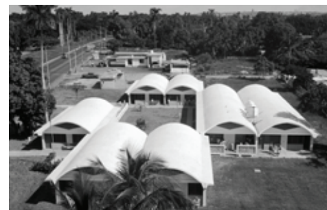
Figura 4: Secundaria Básica 37 y 158, Versalles, La Lisa. Arq. Mario Girona