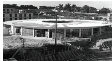
Figura 6: Círculo Infantil Olivio Raúl Piriz, Arq. Rafael Mirabal, 1963, 39 y Panorama, Nuevo Vedado.

5. Entrevista al arquitecto Mario Girona. junio de 2003.