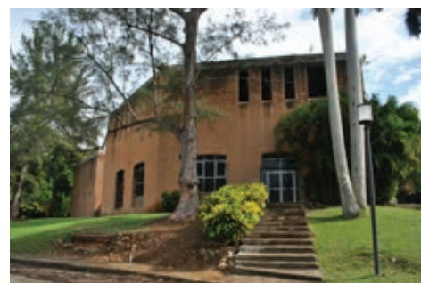
Figura 25: Escuela de Artes d Dramáticas, Arq. Roberto Gottardi.