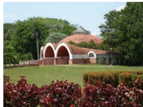
Figura 23: Escuela de Artes Plásticas, Arq. Ricardo Porro.

Al triunfo de la Revolución en Cuba solo existían tres universidades, la Universidad de La Habana, la Universidad Central de Las Villas y la Universidad de Oriente. Como consecuencia de la Reforma Universitaria,