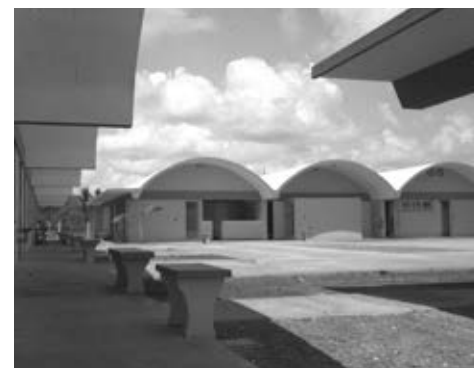
Figura 13: Secundaria Básica en Minas, Camagüey, Arq. Josefina Rebellón.