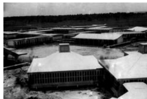
Figura 21: Instituto Tecnológico de Suelos y Fertilizantes. Arq. Vittorio Garatti. Fuente: Fondo del Ministerio de la Construcción, procesado por Juan de las Cuevas.