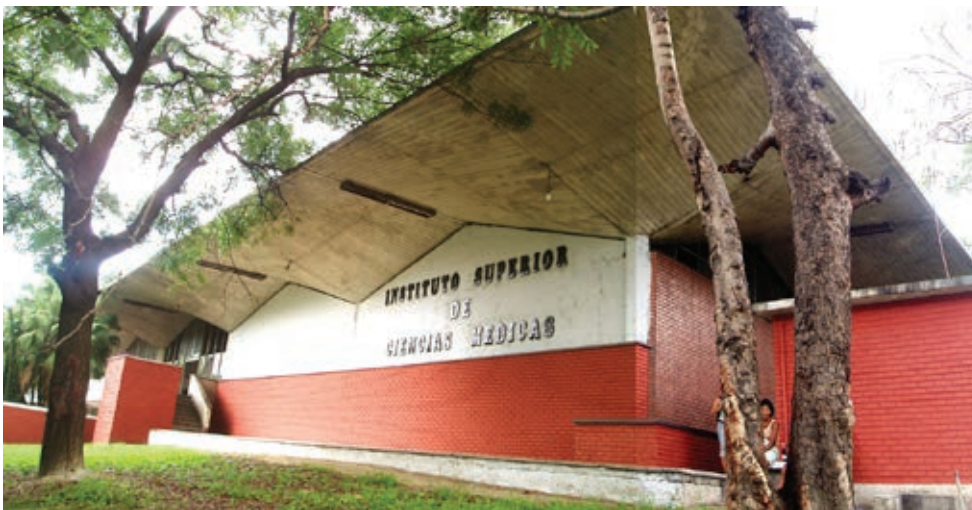
Figura 22: Escuela de Medicina de la Universidad de Oriente.

La primera Escuela de Medicina fuera de la capital de Cuba fue construida entre 1961 y 1963 en la Universidad de Oriente, a partir del proyecto del arquitecto Rodrigo Tascón y el ingeniero Jorge Vinuesa. Figura 22 Esta escuela, una de las obras más sobresalientes de la década en la región oriental de Cuba, es una edificación organizada alrededor de un patio central rodeado de galerías, al que convergen las aulas, los locales para efectuar prácticas y los laboratorios. El conjunto muestra una excelente combinación de espacios abiertos y cerrados, una adecuada integración con la naturaleza circundante y un creativo uso de las posibilidades plásticas del hormigón armado. La textura obtenida por la huella de los encofrados le otorga una expresión brutalista al conjunto.