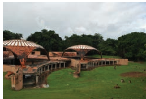
Figura 24: Escuela de Ballet, Arq. Vittorio Garatti.