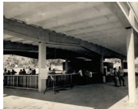
Figura 20: Cafetería Instituto de Ciencias Básicas Victoria de Girón

Al instituto lo caracterizan los techos piramidales de los comedores, próximos al acceso principal; tres edificios cuadrados con plantas a diferentes niveles, enlazados por varias galerías circundantes, y el particular diseño de los bloques para aulas con pórticos prefabricados de hormigón que evitan los ángulos rectos. Fue pensado como una Ciudad Juvenil en la que se albergarían 2000 estudiantes para formarse como maestros de la agricultura mecanizada. La planta en forma de T comprende un cuerpo central para clases teóricas y las alas para dormitorios, y en la intersección de los bloques se ubican los baños. En cada nave se dispusieron cuatro aulas de 30 estudiantes con ventilación cruzada, protegidas del sol por galerías. La circulación se realiza a través de corredores techados prolongados al exterior, con la plaza como foco central del conjunto, delimitada como en una ciudad, por los edificios de funciones colectivas, el salón de actos, los tres comedores, la cocina, la lavandería, las oficinas y el laboratorio. El empleo de un sistema prefabricado diseñado expresamente para la construcción de esa escuela, permitió lograr una adecuada relación entre las necesidades prácticas de la construcción de los elementos prefabricados, su función y su imagen.