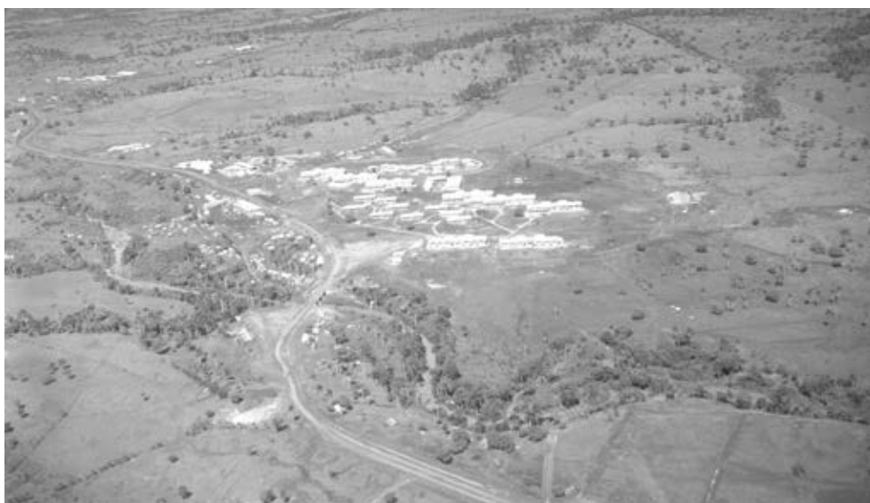
Figura 11: Ciudad Escolar Camilo Cienfuegos para 20 000 alumnos en la Sierra Maestra, 1960. Extenso conjunto urbano con una trama abierta, representativo de una nueva concepción de la enseñanza.

7. SEGRE, Roberto. Diez años de Arquitectura en Cuba Revolucionaria . La Habana: Ediciones UNIÓN, 1970, p. 63-64.