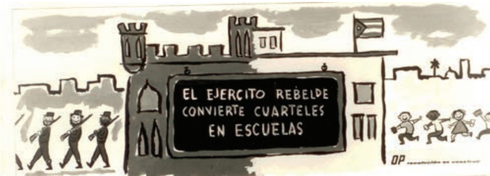
Figura 7: Cartel el Ejército Rebelde convierte cuarteles en escuelas.