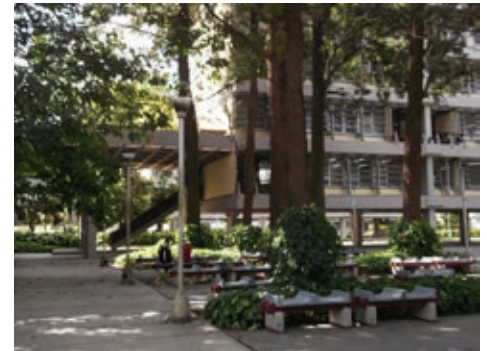
Figura 27: Ciudad Universitaria José Antonio Echeverría, CUJAE.