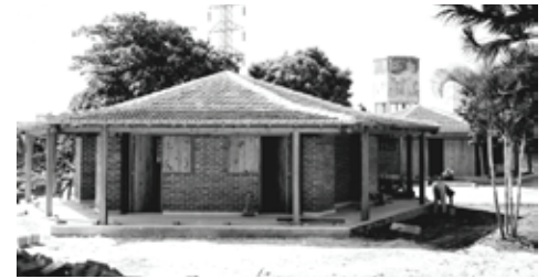
Figura 1: Escuela rural en Avenida Rancho Boyeros, La Habana. Arqs. Matilde Ponce y Alberto Robaina.

Las escuelas urbanas exigieron mayor cantidad de aulas. Se elaboraron varios Proyectos de Escuelas Nacionales Primarias que se repitieron en