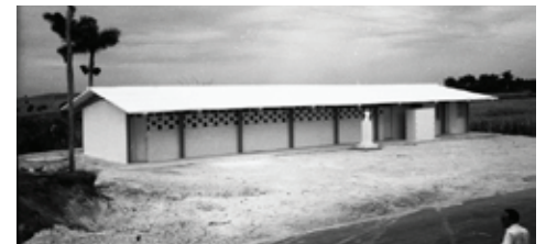
Figura 2: Escuela rural en Quiebrahacha, Artemisa. Arq. Eduardo Ecenarro.