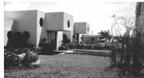
Figura 3: Escuela Arístides Viera, La Lisa, La Habana. Arq. Ángel Macías

Cuando se habla de la arquitectura escolar de estos años no sólo se hace referencia a las nuevas construcciones, incluye además la conversión en