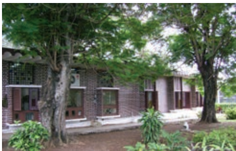
Figura 18: Conservatorio de Música Alejandro García Caturla, Arq. Alberto Robaina, 1961.

El uso de grandes paramentos de ladrillo a vista es también distintivo del conocido Policlínico de Carlos III, que nació como proyecto para Escuela de enfermeras, concebido por las arquitectas Josefina Rebellón y Zulma Saad, pero no llegó a funcionar con ese fin, pues antes de terminarse fue adaptado para policlínico, con la colaboración de los arquitectos Félix Pina y Natacha de la Torre [13]. Figura 19. Es esta una de las edificaciones más representativas de los preceptos formales que distinguen la arquitectura de los años sesenta, por su marcado énfasis en los elementos estructurales de hormigón armado en blanco, contrastando con el rojo de ladrillos a vista y las celosías cerámicas,