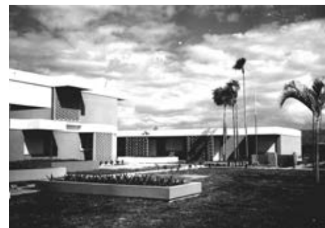
Figura 12: Secundaria Básica en Esmeralda, Arq. Mirta Merlo, 1961.

En esa misma fecha se concibió un plan para estudiantes de Secundaria Básica con becas, emplazado en la Playa Tarará, al este de La Habana. Los alumnos se alojaron en las casas de lo que había sido un reparto de residencias de veraneo y se construyeron nueve Secundarias Básicas a partir de un proyecto típico de hormigón prefabricado con cubiertas tipo folders, que fue lo suficientemente flexible para permitir que cada escuela tuviera una composición diferente. En todos los casos los bloques se enlazaron con galerías techadas, áreas verdes y áreas de juegos. Figura 14