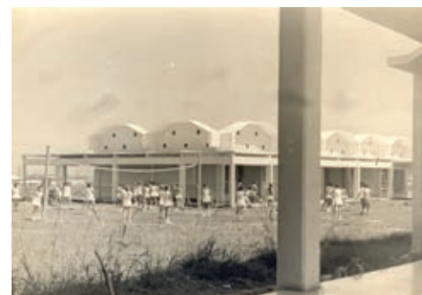
Figura 14: Secundarias Básicas en Tarará, 1961.