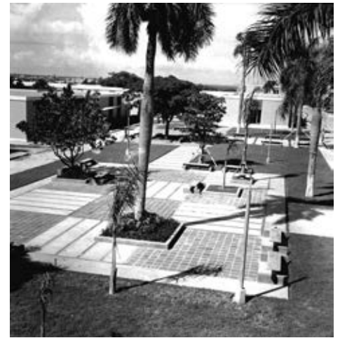
Figura 8: Parques entre las unidades docentes.

En Ciudad Libertad se trabajó en la adaptación de las antiguas instalaciones del cuartel, a la par de la construcción de nuevas edificaciones. Las bóvedas de diferentes dimensiones y curvaturas sirvieron como marquesinas para jerarquizar los accesos de las unidades docentes o como techos de galerías abiertas que intercomunican diferentes bloques, mientras el empleo de paños de celosías y aleros cerámicos frente a los ventanales protege del sol a estos edificios e identifica su expresión. Entre las unidades docentes se crearon áreas de parques Figura 8 en los cuales los alumnos realizan