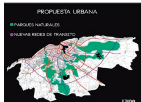
Figura 3: La Bahía entendida como centro líquido de la ciudad, como una gran plaza contenedora de flujos, espacios y puntos de encuentros conectando todo lo existente.