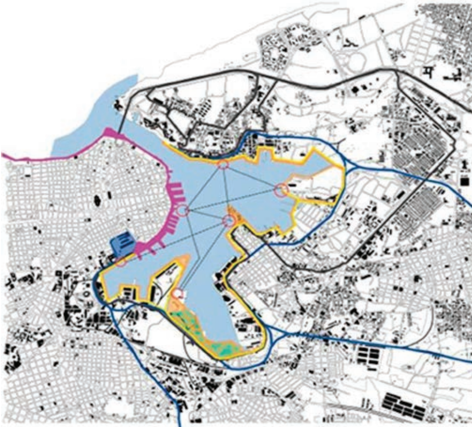
Figura 5: Plan de conexiones. Tratamiento del borde definiendo borde de costa, paseo peatonal con arbolado, ciclovía, jardines, ferrovía y calle.

Otra idea común, fue la de pensar en la conexión de los diferentes sectores establecidos y la ribera de la bahía, como una continuidad que combina variados medios de transporte (autobús, ferrocarril, bicicleta) y paseos por tierra, así como circuitos de botes en la zona marítima. (Figura 5)