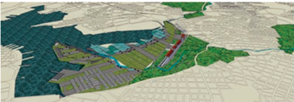
Figura 8: Propuesta de módulo productivo para zona sur de la bahía. Infraestructura de conexión, áreas de cultivo de experimentación, piscicultura, centro de investigación y vivienda universitaria.