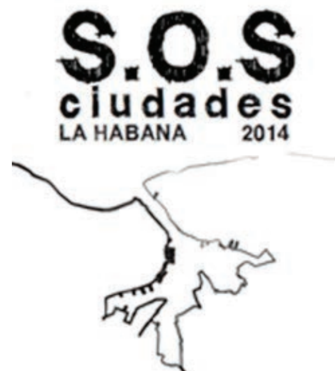
Figura 1: Logo del taller SOS. Diseño: Arq. Enildo García Lima.

Uno de los retos del taller fue el de propiciar un espíritu de colectivismo e intercambio aprovechando el alto número de estudiantes y universidades de América Latina participantes. 2 La amplia variedad de asistentes implicó actitudes heterogéneas al enfrentarse al ejercicio académico, en tanto responden a paradigmas distintos a los del contexto cubano. Estas diferencias fueron convertidas en oportunidades para la reflexión, lo que trajo como resultado la creación de nuevos modelos construidos en colectivo, como parte del aprendizaje y de un espacio de reconocimiento desde la perspectiva de diversas culturas.