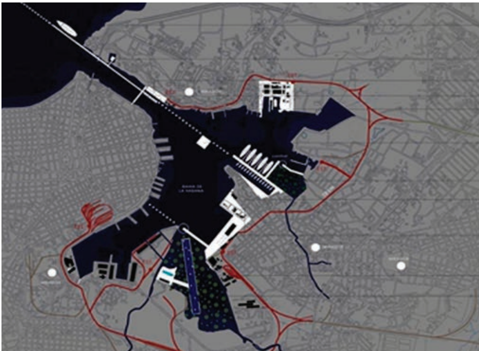
Figura 9: Concepción de un embarcadero de cruceros fuera del canal de la bahía. Conexión con la Habana Vieja por un puente.