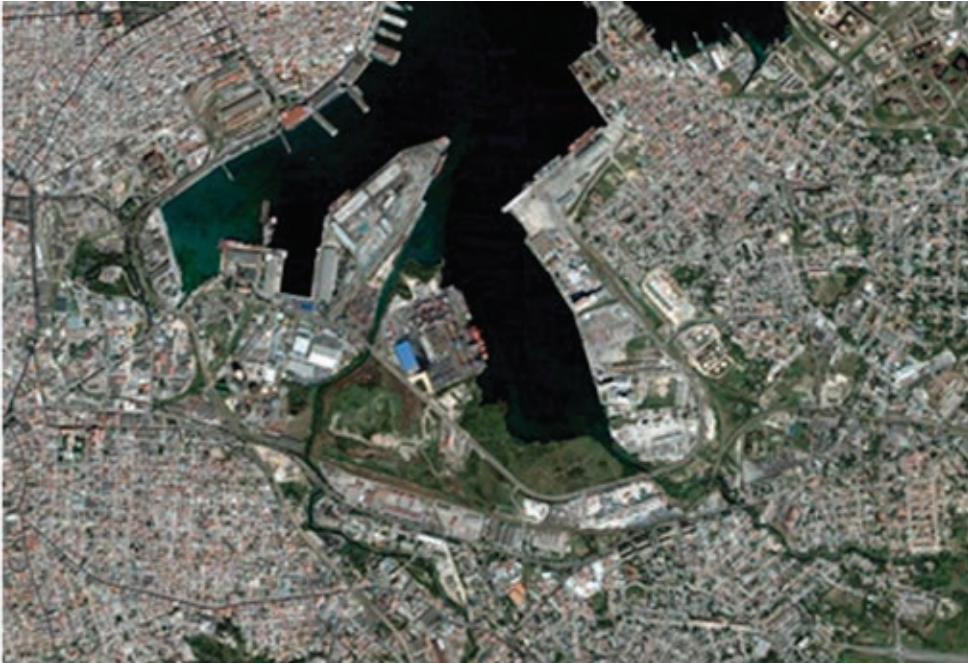
Figura 7: Sector sur de la bahía con predominio de extensa zona verde.