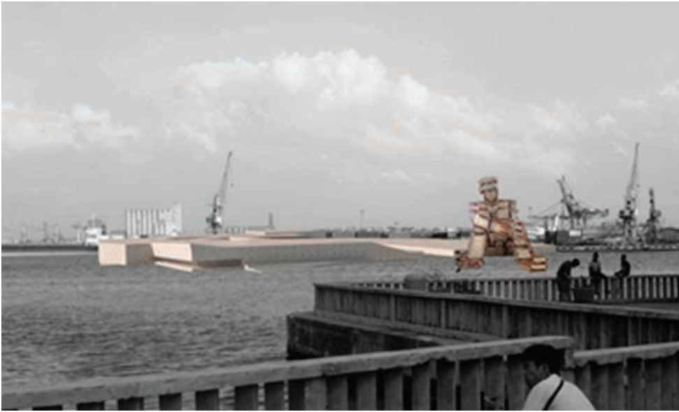
Figura 4: Potencialización de la actividad marítima y la cultural.

investigación entre otras. También se potenciaron las actividades marítimas y las culturales, como la música, los estudios de cine y televisión, las artes gráficas y los museos. (Figura 4)