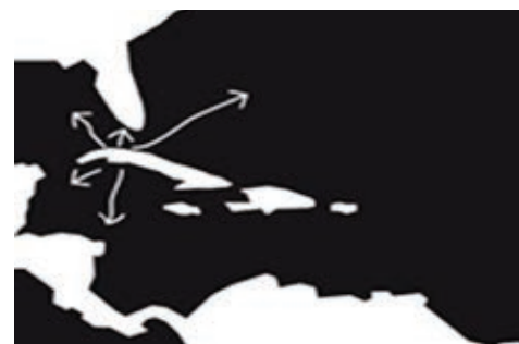
Figura 2.: Bahía como centro irradiador hacia el Caribe, América y el mundo.