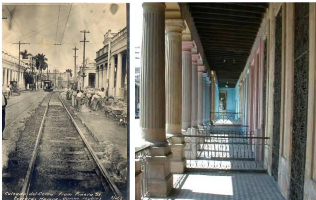
Imagen No.1 La Calzada del Cerro desde la Calle Piñera, durante su reparación. 1915. Imagen actual de portales continuos, públicos y privados que se combinan en sus calles principales como característica de su arquitectura.