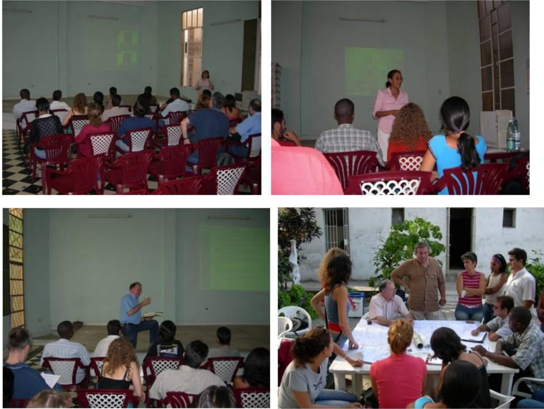
Imagen No. 3 Sesiones de trabajo del taller (conferencias) en el Museo Municipal del Cerro.